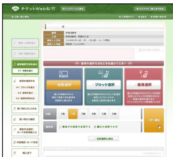
←座席指定の画面イメージ