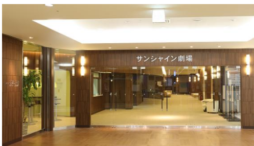
「サンシャイン劇場」