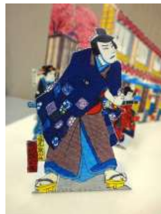
組上燈籠『歌舞伎座新狂言俠客 春雨笠中之町場組上ケ三枚続』 (明治30年) 逸見鉄心斎=初代猿之助

初代猿之助 (安政2年[1855]～大正11年[1922])は、立師(たてし)として知られた坂東三太郎の長男です。坂東羽太郎の名で文久2年[1862]9月市村座『花川戸未熟者中』の幡随院長兵衛倅長松役で大歌舞伎の初舞台を踏みます。明治4年に九代目團十郎の門人となり、猿之助の名乗りを許され重用されますが、同門の妬みを買って一座を離れる間、明治6年中島座において師に無断で『勸進帳』の弁慶を演じたため破門されます。明治23年ようやく帰参がかない、以後團十郎一門として活躍し、明治38年の九代目團十郎の三回忌追善興行では、師匠の着物を身に付けて弁慶を務めます。明治43年[1910]10月歌舞伎座『鎌髭』で、長男團子に猿之助の名を譲り、自らは二代目市川段四郎を襲名しました。