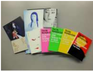
「亀治郎の会」第1回～第9回プログラム

四代目猿之助(昭和50年[1975]～)は、四代目段四郎の長男で、二代目猿翁(＝三代目猿之助)の甥にあたります。昭和55年7月歌舞伎座『義経千本桜』安徳帝で初お目見得、昭和58年7月『御目見得太功記』の禿(かむろ)たよりで二代目亀治郎を名乗り初舞台を踏みます。学業では伯父と同じく慶應大学に進み、国文学を専攻します。『加賀見山』のお初や『NINAGAWA十二夜』の麻阿、『色彩間苺豆』のかさねなど、女形としての高い評価が続く中、平成19年、テレビ初出演のNHK大河ドラマ『風林火山』では武将武田信玄を熱演、以後時代劇のみならず、ドラマ、バラエティー、教養番組と映像出演も増えます。海外では、ヨーロッパ公演で踊った『色彩間苺豆』で、英国ローレンス・オリビエ賞最優秀ダンス賞にノミネートされ高い評価を得ます。平成14年の第1回から平成23年の第9回まで続いた自主公演「亀治郎の会」では様々な大役に積極的に挑戦します。今年5月渋谷ヒカリエオープンイベントとして「亀博」を開催、第8回「亀治郎の会」で狐忠信役に初挑戦する様子の記録映画の上映や、狐忠信が活躍する『義経千本桜 河連法眼館の場』の舞台を再現した展示が話題を呼びました。亀治郎の名で最後の舞台は本年4月『仮名手本忠臣蔵』の勘平役でした。今年140年以上続く猿之助の名跡を襲名します。