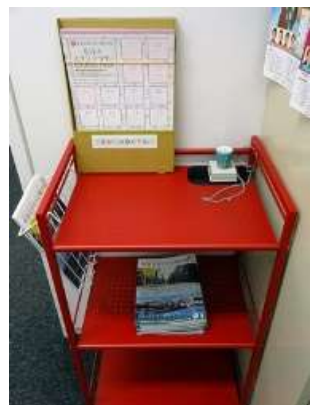
▲松竹大谷図書館スタンプ台の赤ワゴン(スタッフの間では赤い彗星と呼ばれています)

まずは、松竹大谷図書館。図書館のエントランス奥に、スタンプ台があります。松竹大谷図書館の閲覧室では、演劇や映画の台本・プログラムなどを閲覧することができます。先日、スタンプラリーで当館を訪れた小学生の女の子が、閲覧室で『ドラえもん』などのアニメ映画プログラムを楽しんでいってくれました。