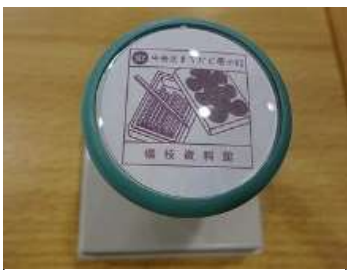
▲「楊枝資料館」のスタンプ

お店のカウンターでスタッフの方にスタンプを出していただき、4つ目のスタンプをGETしました！