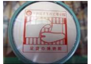
▲「足袋の博物館」のスタンプ

スタッフの方に出していただいた「足袋の博物館」のスタンプを押して2つ目をGET！そこから歩いて八丁堀駅へ行き、日比谷線で小伝馬町駅へと移動します。