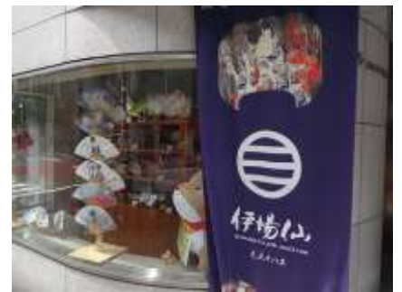
▲400年以上の歴史を誇る伊場仙