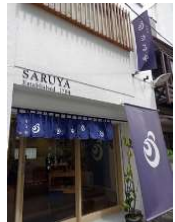
▲白と濃紺のコントラストが美しいさるや

4カ所を巡って、ここまでの所要時間は約2時間。「日比谷線で移動する」という独自ミッションも併せて達成し、スタンプラリー完了です。松竹大谷図書館をスタートし、江戸時代から現代まで人々の生活を彩り豊かにし、粋な江戸文化を支えてきた三つのお店が運営するまちかど展示館を巡るスタンプラリーで歩いた数は6000歩以上！案内通りの最寄り駅を使って効率的に移動するのもいいけれど、普段は降りたことのない駅を使って道に迷いながら歩いてみると、知らない景色や、歩く途中で発見したお店なども巡り合うことができ、短時間なのにまるで小旅行のようでした。中央区を巡る「江戸バス」なども使ってみるのも新たな発見があって楽しそうです。中央区にある歴史あるお店やスタンプラリーを楽しみながら、江戸の文化を支えた職人の技に触れ、歴史・文化などを学ぶことのできる「まちかど展示館」巡りをしてみてはいかがでしょうか。