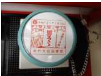
▲松竹大谷図書館のスタンプはコレ!!『男はつらいよ』のロゴはホンモノです!

せっかくなので、酒井もスタンプラリーに挑戦してみました。今回、巡ることにしたのは、足袋の博物館(02番、ピンク色枠)、松竹大谷図書館(04番、ピンク色枠)、楊枝博物館(06番、紫色枠)、伊場仙浮世絵ミュージアム(09番、紫色枠)の4館です。地図を見てみると、それぞれ少しずつ歩けば、日比谷線だけで、回れるかも?!と思いついたので、「日比谷線だけで巡る」というミッションも独自に追加して、スタンプラリースタートです!