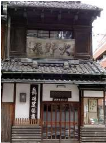
▲趣きのある大野屋の外観