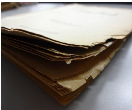
『東京キッド』(1950年、斎藤寅次郎監督作品)のスクラップ。表紙の縁の劣化と歪みが目立つ