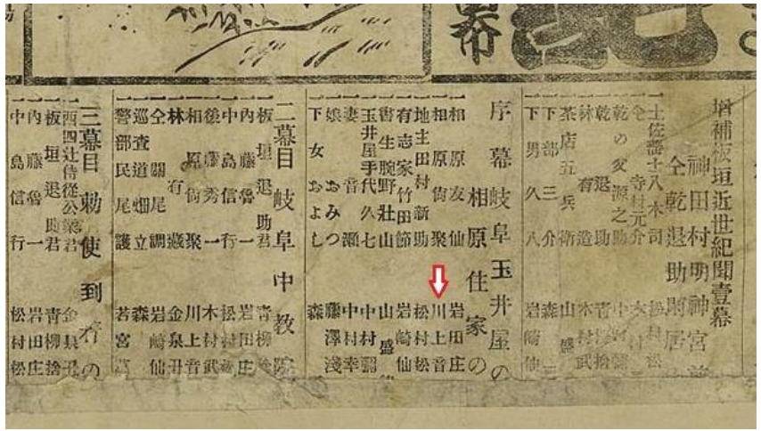
俳優名が「川上音」で裁断されている番付の下の配役部分

に嬉しかった、と自身の著書『絵番付・新派劇談』の中で述べています。少し小さい判の番付の裏打ちに使われて、小さい寸法に合わせて裁ってあったため、下の役割名の役者の名の半分くらいから下が無くなっているのが、その名残となっています。