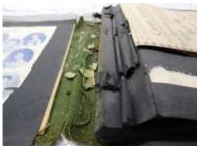
経年劣化により、表紙から台紙が剥がれた状態の【川上音二郎・貞奴アルバム】