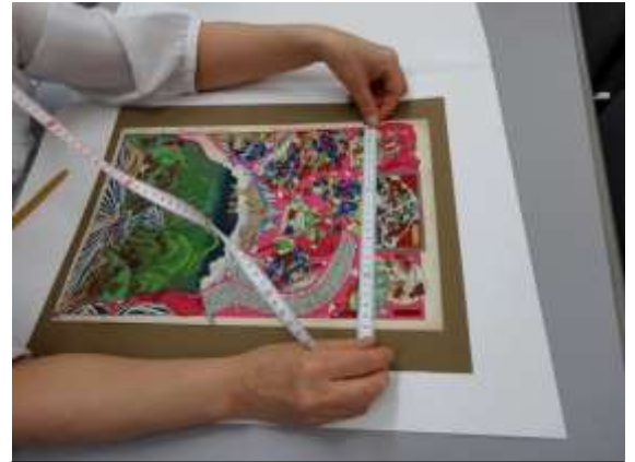
当館にて藤澤浮世絵館の学芸員の方が採寸作業をされました

藤沢市藤澤浮世絵館のHPはこちら http://fujisawa-ukiyoekan.net/