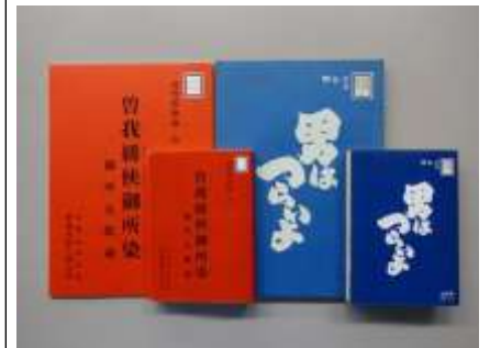
「歌舞伎台本」文庫本カバー[左]