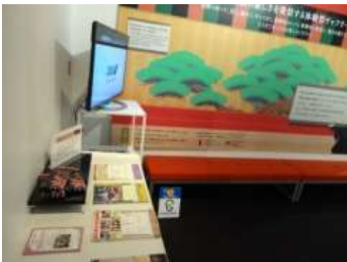
「歌舞伎座ギャラリー」入口

さまざまな関係先で、第8弾クラウドファンディングのチラシを配布していただいております。お出かけ先でお気づきになりましたら、是非手にお取りください。