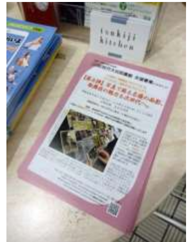
松竹本社が入っている東劇ビル地下のレストラン「tsukiji kitchen」の店頭にも！