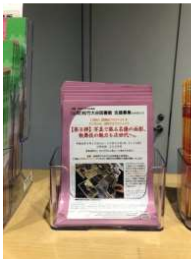
木挽町広場「地域情報コーナー」