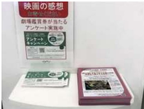
新宿ピカデリー 2階口ビー