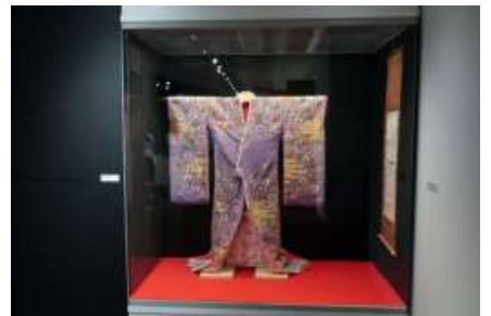
ソ連公演『京鹿子娘道成寺』“恋の手習い”衣裳