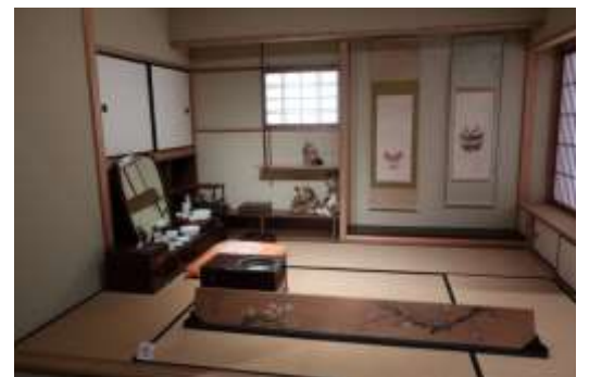
楽屋を再現した部屋。手前が自筆の紅白梅図の欄間