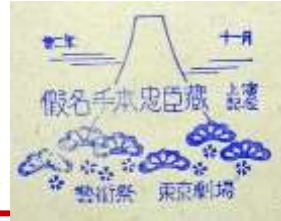
スタンプ部分拡大→

臨時休館に伴い、開催中の閲覧室ミニ展示「東劇90周年」展もご覧いただけなくなっておりますので、東劇関連資料をおひとつご紹介いたします！右の資料は、昭和22年11月に東京劇場で通し上演された『仮名手本忠臣蔵』のプログラムです。表紙の中心右側に観劇記念のスタンプが押されています。