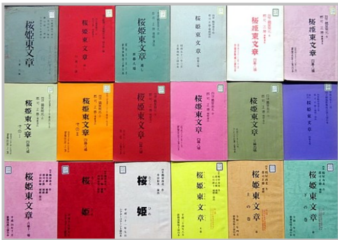
『桜姫東文章』各上演台本

これらの資料は閲覧室でお読みいただけますので、ぜひこの機会に、『桜姫東文章』の世界にどっぷり浸ってみてはいかがでしょうか。ご予約お待ちしております。