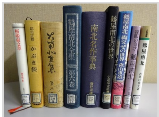
『桜姫東文章』関連図書