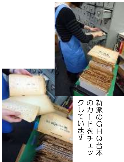
新派のGHQ台本のカードをチェックしています

▼編集後記 現在、二週間の春期特別整理休館に入っております。大量寄贈された資料の所蔵チェック及び登録や、所蔵資料の大規模な書架移動の準備など、この休館期間中に集中して取り組める作業に勤しんでおります。利用者の方にはご不便をおかけいたします。