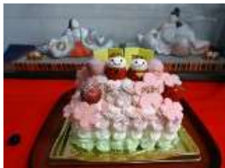
雛祭りに可愛らしいケーキをいただきました！ 美味しくいただきました。