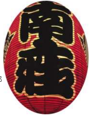
南座の提灯(『南座』の表紙より)