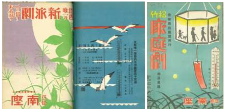
昭和10年8月の新派劇プログラム2種【左】と昭和11年7月の松竹家庭劇プログラム【右】

椅子席が設けてあるほか、冷暖房完備『昭和の南座』による』という近代的な劇場となりました。昭和10(1935)年6月から8月のプログラムには、「京都唯一理想的冷房装置愈々完備 最新優秀の冷凍機七十五馬力二台を新設して、夏なほ寒き涼風を送り場内、休憩室は避暑好適のいごちです」と謳われています。今回の展示でもご紹介している昭和11(1936)年7月に上演された松竹家庭劇のプログラムの表紙にも、温度計のイラストと「場内二十四度」という文字が描かれており、劇場の涼しさが視覚的に伝わるものになっています。