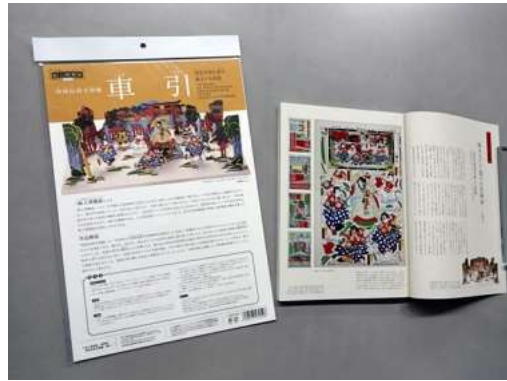
左:組上燈籠絵復刻版「車引」(1,500円) 右:『演劇界』2018年12月号掲載「江戸芝居百景」

『演劇界』2018年12月号で、当館が所蔵する組上燈籠絵『菅原天神記車引組上ケ五枚続』を紹介していただきました。巻頭の歌舞伎を題材にした浮世絵の名品を紹介する「江戸芝居百景」という連載記事で、歌舞伎の三大名作の一つ『菅原伝授手習鑑』の「車引」の場が描かれた5枚組の大版の「組上燈籠絵」を取り上げていただいております。「車引」の登場人物の横には、それぞれ俳優の名と役名がありますが、実際にはこの配役での上演の記録は残されていません。当時、この組上燈籠絵を買った人は、この夢の配役の舞台を自宅に作り上げ、楽しんだに違いありません。なお、当館向かいの東劇ビル1Fのリプロ銀座店では、『演劇界』とともに「車引」復刻版も販売しております。是非お手にとってご覧くださいませ。