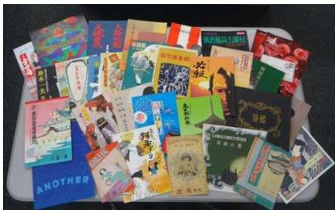
南座で上演された多岐にわたるジャンルの演劇プログラム

時代は太平洋戦争へと突入し、昭和19(1944)年3月になると、高級享楽停止令により南座も閉場を余儀なくされましたが、翌4月にはすぐに除外され、映画の封切り場となり、10月には演劇場として再開、12月の顔見世興行も幕を開くことができました。このように「顔見世」は戦中も含め、一度も欠けることなく毎年続けられ、京都の冬の風物詩として、人々に愛され続けてきました。