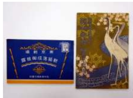
左:書籍『東京劇場新築落成御披露』 右:プログラム「新築落成披露第一回興行」

本年はこの東劇が、90周年という節目を迎える年となります。今回の展示では、戦前から戦後にかけての東京劇場に関する資料を演劇・映画両分野から選び、展示します。