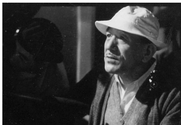
小津安二郎監督

名匠・小津安二郎監督が撮影し、名優・六代目尾上菊五郎が踊った歌舞伎記録映画『鏡獅子』。ビネガーシンドロームによる劣化が進み、一刻も早いデジタル化が望まれるこの貴重な映像を、4Kデジタル修復により蘇らせ次世代まで届けるため、このプロジェクトを無事達成することができますよう、一層のご協力・応援を何卒よろしく願いいたします。