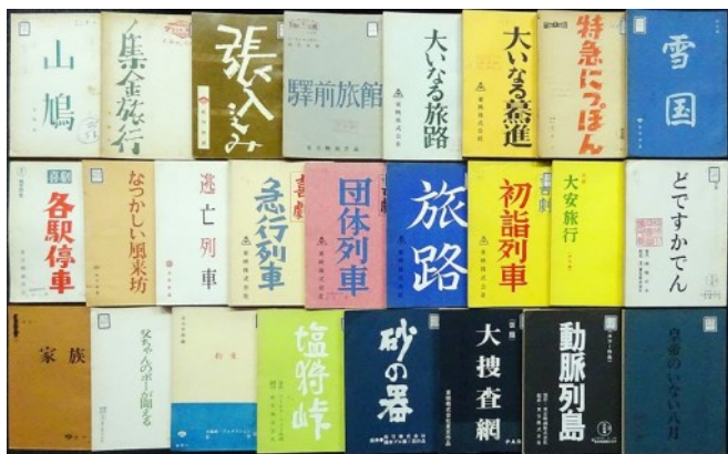
《1950年代より1970年代まで》左上より:『山鳩』『集金旅行』『張込み』『喜劇 駅前旅館』『大いなる旅路』『大いなる慕進』『特急につぼん』『雪国』『喜劇 各駅停車』『なつかしい風来坊』『逃亡列車』『喜劇 急行列車』『喜劇 団体列車』『旅路』『喜劇 初詣列車』『喜劇 大安旅行』『どですかでん』『家族』『父ちゃんのボーが聞こえる』『約束』『狸狩峠』『砂の器』『新幹線大爆破』『動脈列島』『皇帝のいない八月』

展示期間: 2022年8月29日～10月26日 展示場所: 松竹大谷図書館 閲覧室 ※展示は予約なしでご覧いただけます(状況によっては、入室をお待ち頂く場合がございます)。※開館日時につきましては、状況の変化にともない変更の可能性がございます。随時当館のHP、Facebookの投稿をご確認下さい。また、お電話でもご案内いたしますので、ご来館前にお問い合わせ下さい。 電話: 03-5550-1694 (平日: 10時～17時)