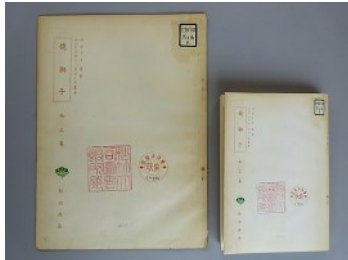
左:本物の完成台本、右:文庫本カバー見本

「完成台本」とは、タイトルバックから、音楽・効果音まで完成した映画の通りに記録された台本を言います。この台本は当館所蔵の『鏡獅子』の完成台本で、映画の映像・音声と同じ内容になっています。この「完成台本」の表紙