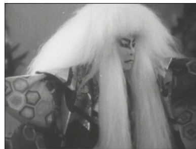
映画『鏡獅子』より 六代目尾上菊五郎

最終回となる10月は、当館所蔵の「歌舞伎記録映画」です。当館では、歌舞伎の舞台を記録した映画を保存管理しております。今回は、日本人によって撮影された現存する最古の映画とされている九世市川團十郎、五世尾上菊五郎の『紅葉狩』や、名匠小津安二郎監督唯一の記録映画『鏡獅子』、当時最高の配役といわれ評判を呼んだ昭和18[1943]年12月歌舞伎座興行中の舞台を撮影した『勸進帳』について、映画の写真とともに詳しくご紹介しています。 ※映画『鏡獅子』はクラウドファンディングで4Kデジタル修復プロジェクトへのご支援を募集中です。(10月26日まで) https://readyfor.jp/projects/ootanitoshokan11