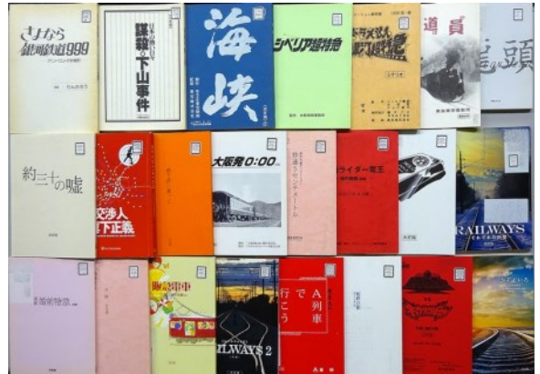
《1980年代より2010年代まで》左上より:『さよなら銀河鉄道999 アンドロメダ終着駅』『日本の熱い日々 謀殺・下山事件』『海峽』『シベリア超特急』『映画ドラえもん のび太と銀河超特急』『鉄道員 ぽっぽや』『ドラゴンヘッド』『約三十の嘘』『交渉人 真下正義』『地下鉄に乗って』『旅の贈りもの 0:00 発』『秒速5センチメートル』『劇場版 仮面ライダー電王 俺、誕生!』『わたし出すわ』『RAILWAYS 49歳で電車の運転士になった男の物語』『婚前特急』『奇跡』『阪急電車 片道15分の奇跡』『RAILWAYS 愛を伝えられない大人たちへ』『僕達急行 A列車で行こう』『起終点駅 ターミナル』『列車戦隊トッキュウジャーVSキョウリュウジャー THE MOVIE』『かぞくいる RAILWAYS わたしたちの出発』