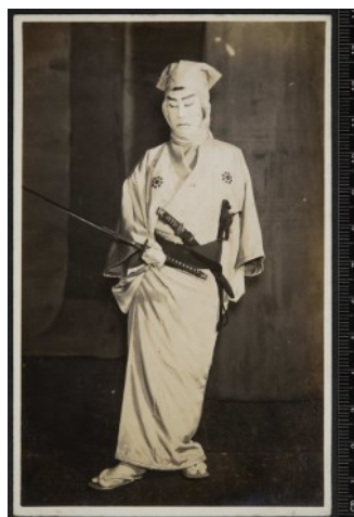
机龍之助 六世市川寿美蔵(のちの三世寿海)

レトロ写真館の連載は、11月はお休みとなります。次回12月の掲載が最終回です。どうぞお楽しみに！