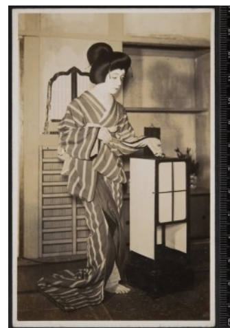
二世中村芝鶴 お銀様