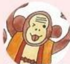
さるわらのひよしまる 猿原日吉丸