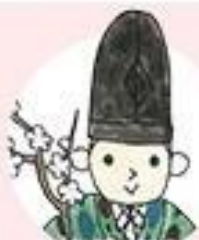
さだいじん 左大臣