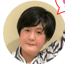
べんがらどうじ 弁柄童子