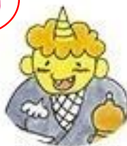
やまぶさどうじ 山吹童子