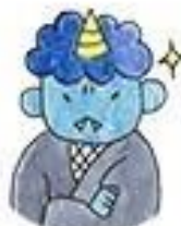
なんどどうじ 納戸童子