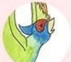
くもいうきじ 雲井の浮路