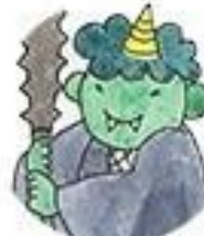
もえぎどうじ 萌葱童子