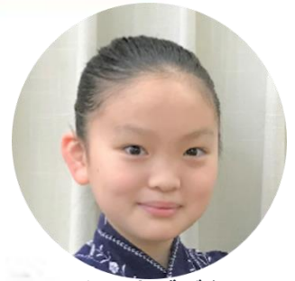
とこよぞぜん 常夜御前