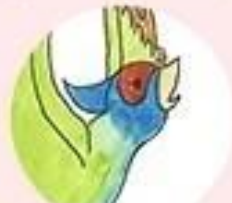
くもいうきじ 雲井の浮路