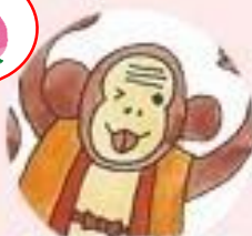
さるわらのひよしまる 猿原日吉丸