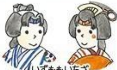
いずもいちざ 出桃一座