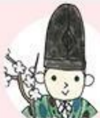
さだいじん 左大臣