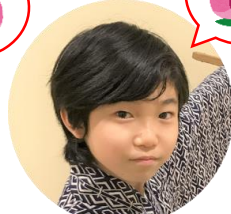
もえぎどうじ 萌葱童子