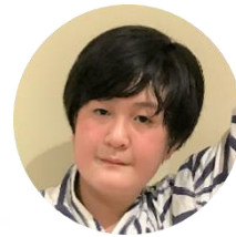
べんがらどうじ 弁柄童子