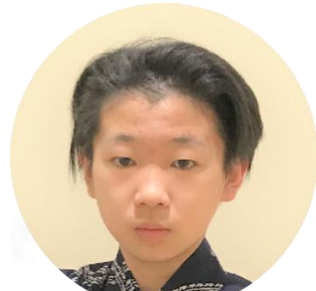
ももたろう 桃太郎