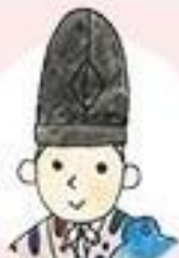
うだいじん 右大臣