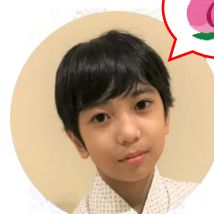
なんどうじ 納戸童子