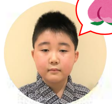
やまふさどうじ 山吹童子