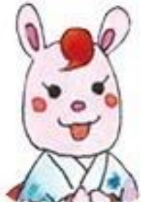
ももももひめ 百桃姫