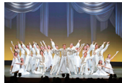
平成29年6月 大阪松竹座 OSK日本歌劇団「レビュー春のおどり」 ©松竹株式会社

株主の皆様におかれましては、今後とも一層のご支援とご理解を賜りますようお願い申し上げます。