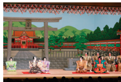
平成29年5月 歌舞伎座「梶原平三誉石切」