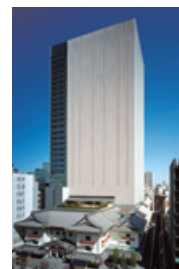
歌舞伎座タワー