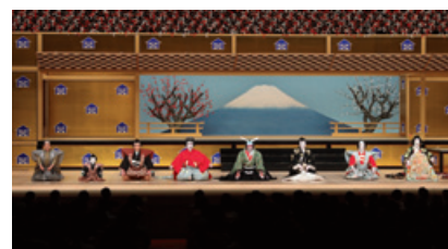
平成29年5月 歌舞伎座「壽曾我対面」