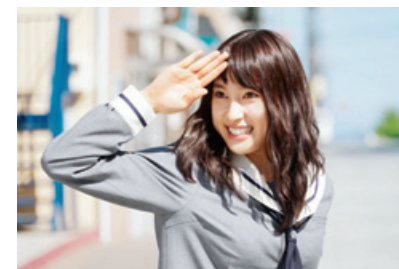
「PとJK」

<<権利販売>>テレビ放映権販売では、BS放送にてBSジャパンで「釣りバカ日誌」シリーズに続いて、「男はつらいよ」シリーズの再契約により、収益に貢献しました。デジタル修復版の海外上映が続く中、小津安二郎監督の「お茶漬の味」(1952年公開)が、8月に開催されたヴェネチア国際映画祭にて上映されました。その他に、LINE公式スタンプで「男はつらいよ 寅さんスタンプ」を発行し、多くのお客様から好評を得ました。