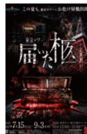
「東京タワーに届いた柩」