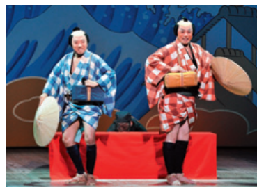
シネマ歌舞伎 「東海道中膝栗毛〈やじきた〉」