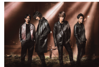
「HiGH&LOW THE MOVIE 3/FINAL MISSION」