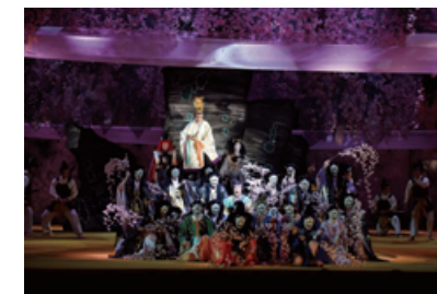
平成29年8月 歌舞伎座 「野田版 桜の森の満開の下」

【CS放送】松竹ブロードキャスティング(株)は、「衛星劇場」「ホームドラマチャンネル」の番組編成強化と広告営業が奏功し、収益の拡大を実現しました。