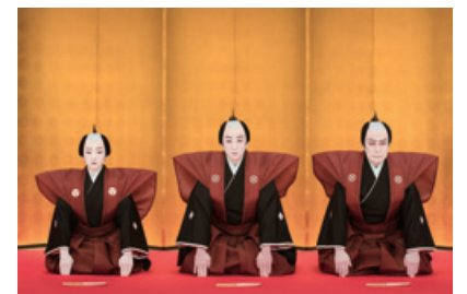
平成30年1月、2月 歌舞伎座 二代目松本白鷗、十代目松本幸四郎、 八代目市川染五郎高麗屋三代襲名公演