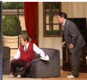
劇団創立 70 周年記念